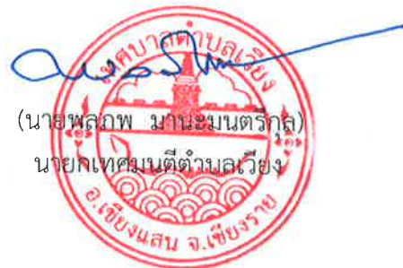
(นายพลภพ มานะมนตรีกุล) นายกเทศมนตรีตำบลเวียง